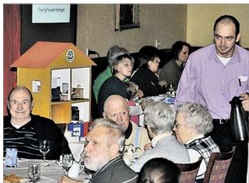
Die Kunden des Pflegedienstes Jansen freuen sich über einen gelungenen Nachmittag.